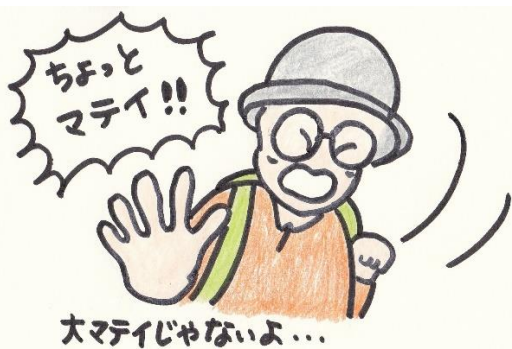
先を急ぐ野崎 SL を制止する鈴木 L の迷言