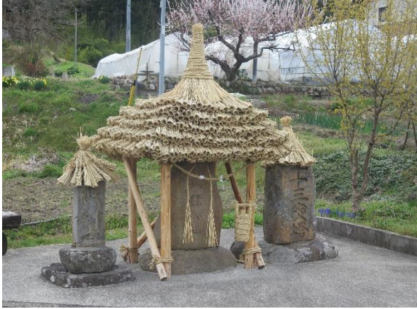
【村の辻にあった道祖神】

安曇野はこの季節、家々の庭先や田圃や畑のあぜ道の至る所に花々が咲き、目を楽しませてくれます。また道の辻々に道祖神があり心が和みます。