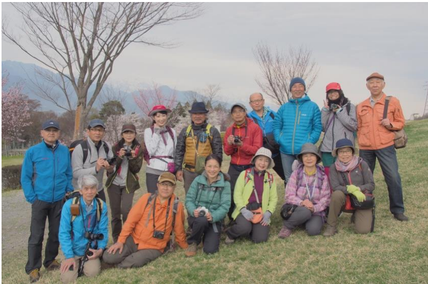
【全員大満足 笑顔・笑顔】

今日は『池田クラフトパーク』周辺の丘を撮影しながらのハイキングです。撮影の後には楽しみも待っています。