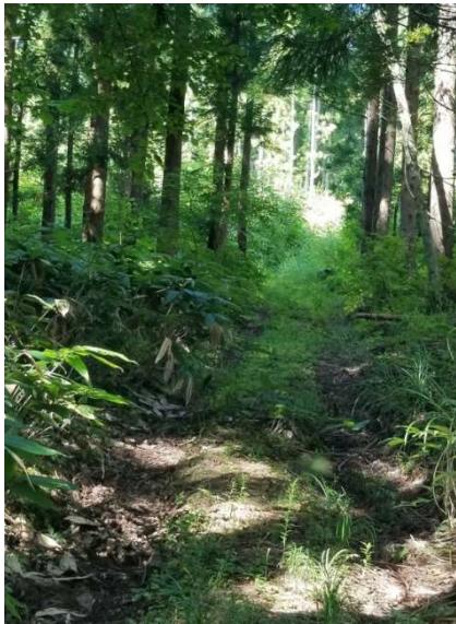
【林道がどん詰まり】

松戸を早朝5:30出発し蓮田で合流、七ヶ岳登山口の会津荒海に8時過ぎに到着しました。