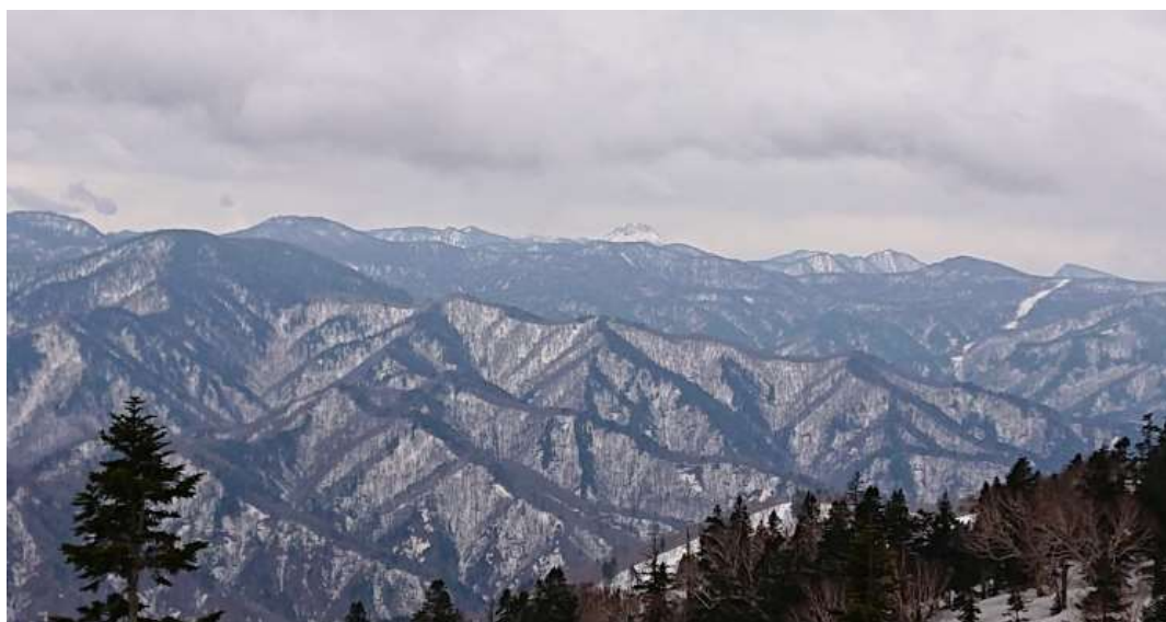
下山時見えた日光方面の山並み。(中央に日光白根と右端は皇海山か?)