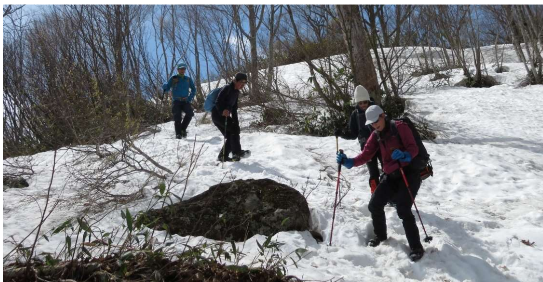
アイゼンを外すのが早過ぎたか。(3合目付近)