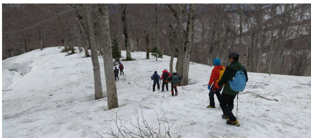
尾根筋を一気に下る。