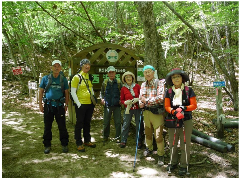
出発前看板前にて

要所々にはクサリが設置されており子供連れでも安心である。七ツ釜五段の滝手前の方杖橋に着く。これから先は通行止めの為、仮登山道を登る。これが凄い急登、急ごしらえの足元が悪い、喘ぎ々登る。たどり着いたのは、旧森林軌道跡の遊歩道である。この先に五段の滝を遠望できる場所があるの