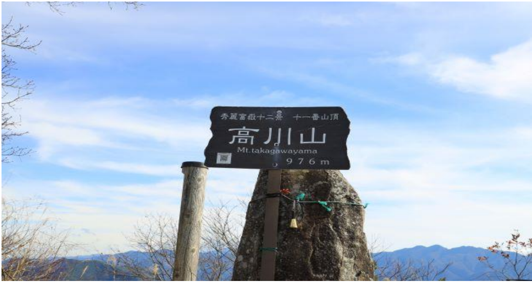
富士山もよく見えて小春日和の様な気温でゆっくりと食事を取ることができました。