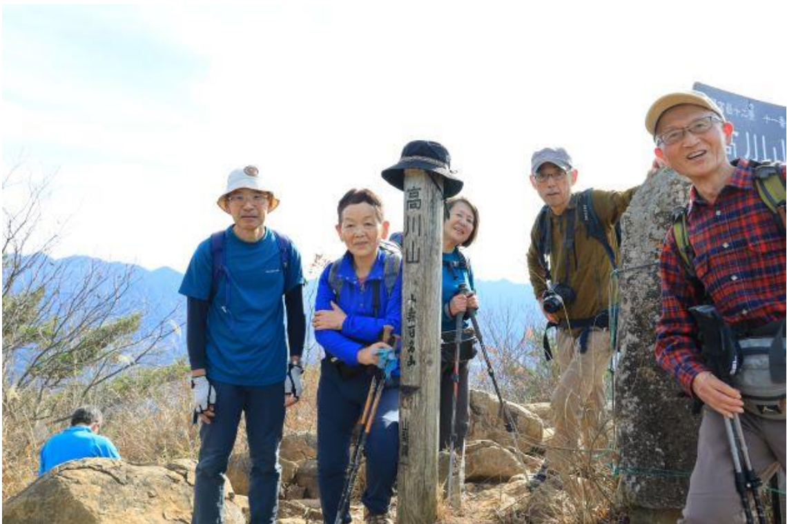
お約束の頂上での集合写真！！